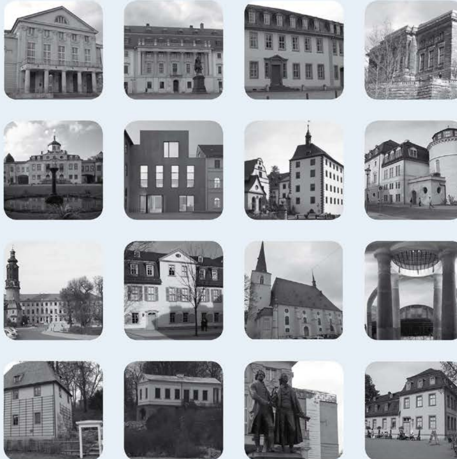
Einige Objekte des Weltkulturerbe Ensembles die von der Klassikstiftung verwaltet werden