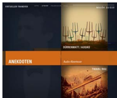
Anekdoten: Dürrenmatt & Twain