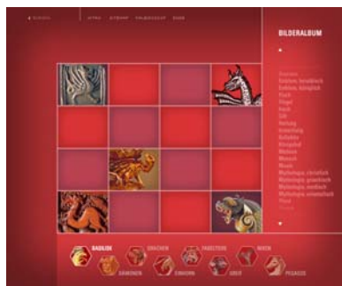
Bilderalbum: Seltsame Wesen

Koproduktion Prototyp CD-ROM: meta Wien ( www.meta.at )