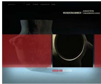
Wunderkammer: Gynäkomorphes Gefäss